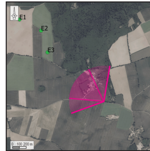
Orthophotographie 1 / 25 000